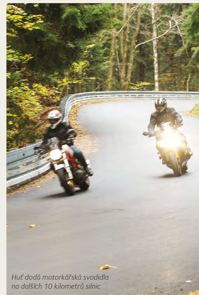
Huť dodá motorkářská svodidla na dalších 10 kilometrů silnic

Po osazení nových úseků motosvodidel jich na českých a slovenských silnicích najdeme celkem 14 kilometrů.